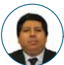
* Jefe del Departamento de Indicadores de la Actividad Económica del BCRP.

En el Perú, las dificultades para el desarrollo productivo se encuentran en diversos ámbitos y los agentes económicos lidian constantemente con distintos problemas como la inseguridad ciudadana o la burocracia.