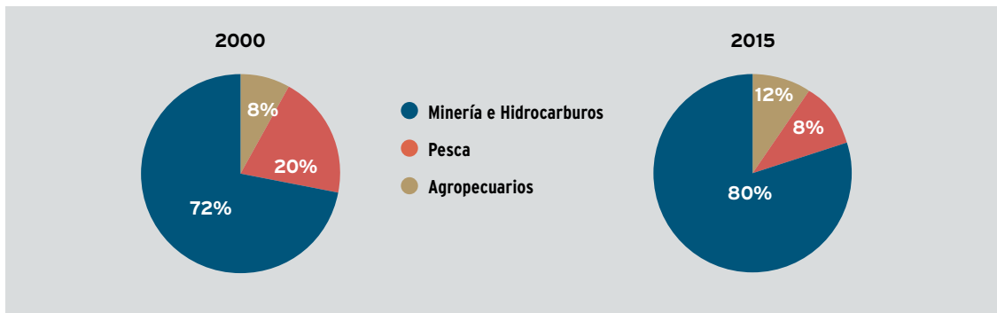
CUADRO 1 ■ Exportaciones por grupo de actividad económica 1/ (Millones de US$)