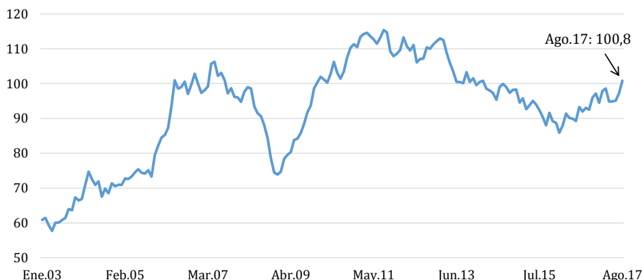
Términos de Intercambio 2003-2017 (2007=100)

El índice de términos de intercambio en agosto fue de 100,8, el nivel más alto registrado desde febrero de 2014.