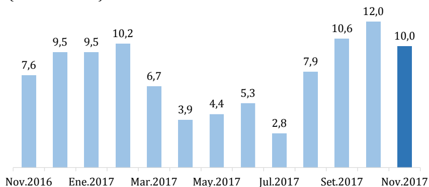
Términos de intercambio (Var. % 12 meses)

Los precios de exportación de noviembre aumentaron en promedio 16,5 por ciento, manteniendo las tasas positivas observadas desde agosto de 2016 por las mayores cotizaciones del cobre (34,7 por ciento) y zinc (34,6 por ciento), derivados de petróleo (34,3 por ciento) y gas natural (24,5 por ciento), mientras que los precios de las importaciones crecieron en promedio 5,9 por ciento, respecto a similar mes del año anterior.